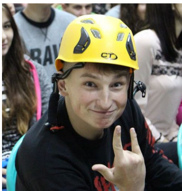
Nasi uczniowie są gotowi do kolejnej wyprawy