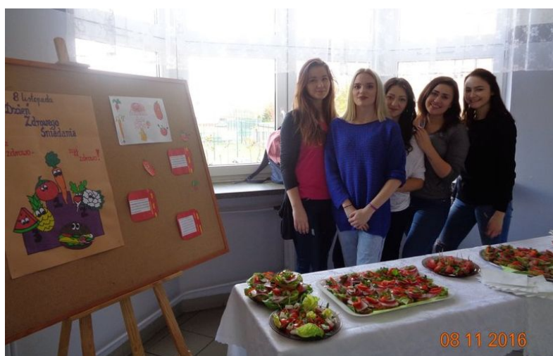
Kanapka w takim towarzystwie to przyjemność