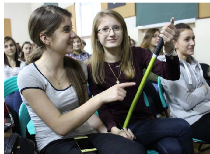
Panie też przygotowują się na podbój świata