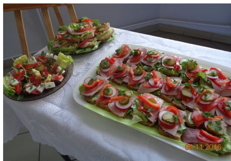
Te kanapki zniknęły w ciągu kilku minut

8 listopada... dla niektórych kolejny, zwyczajny jesienny dzień. W naszej szkole udowodniliśmy, że jednak nie jest on taki zwyczajny i że nie tylko liście są kolorowe jesienią. Już od rana w szkolnej stołówce grupa dziewczyn z klasy II B uwijała się niczym w Hell's Kitchen przygotowując pyszne, kolorowe kanapki i inne smakołyki. Nie bez powodu wybraliśmy ten termin, gdyż 8 listopada jest Dniem Zdrowego Śniadania.